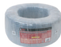
EMPAQUE MIN: 1